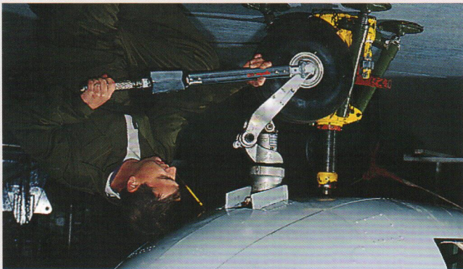
14040 EINSTELLBARER DREHMOMENTGRIF - DOPPELSKALA Pro 650, 22-mm-Zapfen, 130 - 650 N·m, 100 - 480 lbf·ft