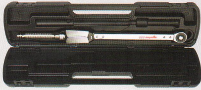
14041 ANPASSBARE INNEN-DREHMOMENTGRIFFE - DOPPELSKALA Pro 650, 14 x 18 mm, 130 - 650 N·m, 100 - 480 lbf·ft